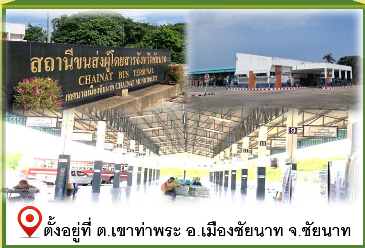
ตั้งอยู่ที่ ต.เขาท่าพระ อ.เมืองชัยนาท จ.ชัยนาท

ข้อมูลทั่วไป : จังหวัดมีเนื้อที่ประมาณ 2,469.746 ตารางกิโลเมตร (1.55 ล้านไร่) ประชากร 315,527 คน มี 8 อำเภอ 53 ตำบล 505 หมู่บ้าน 1 เทศบาลเมือง 38 เทศบาลตำบล และ 20 อบต.